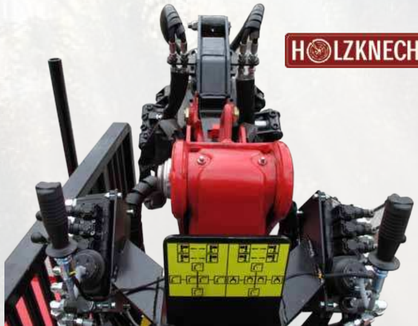
■ Mehrere Steuerungsvarianten möglich