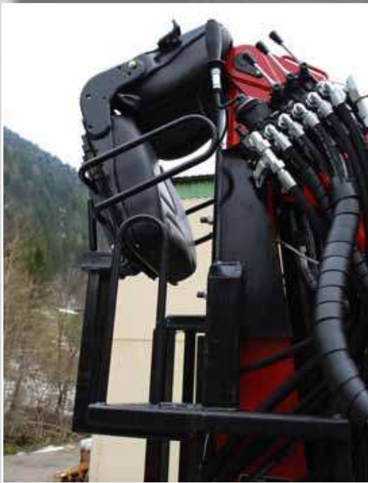
■ Hochsitz optional erhältlich