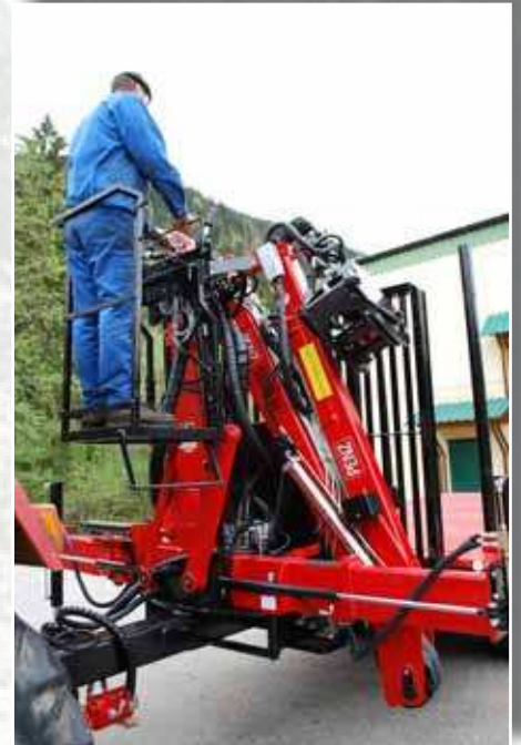
■ Optimale Übersicht