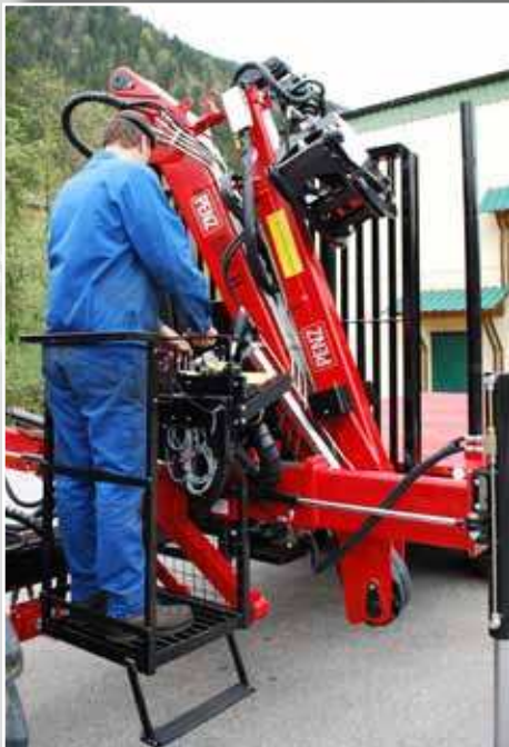
■ Hebellift serienmäßig