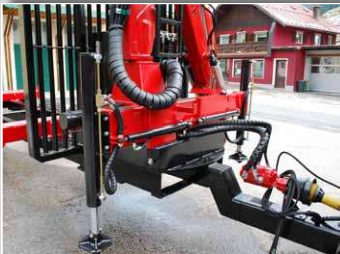
■ Tandempumpe 2 x 35 Liter Gußausführung