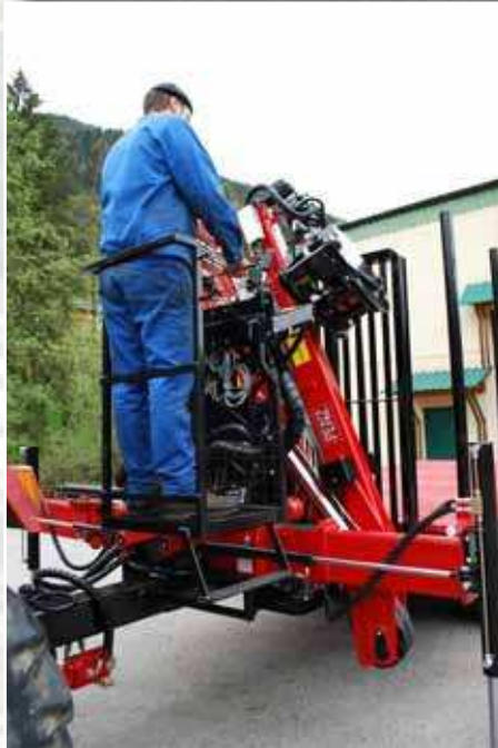
■ Hydraulisch höhenverstellbar