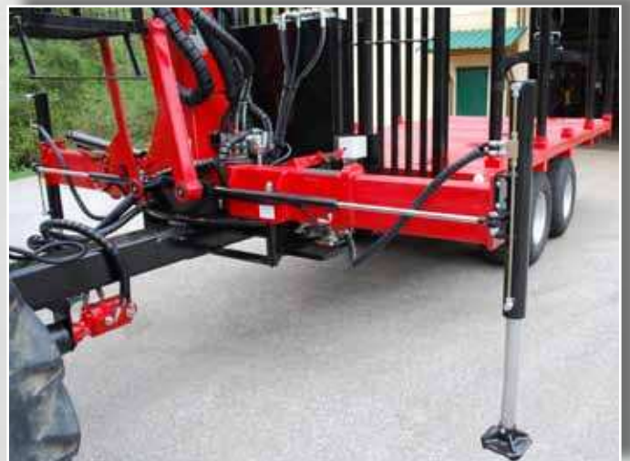
■ Hydraulische Abstützung wie bei LKW Kränen