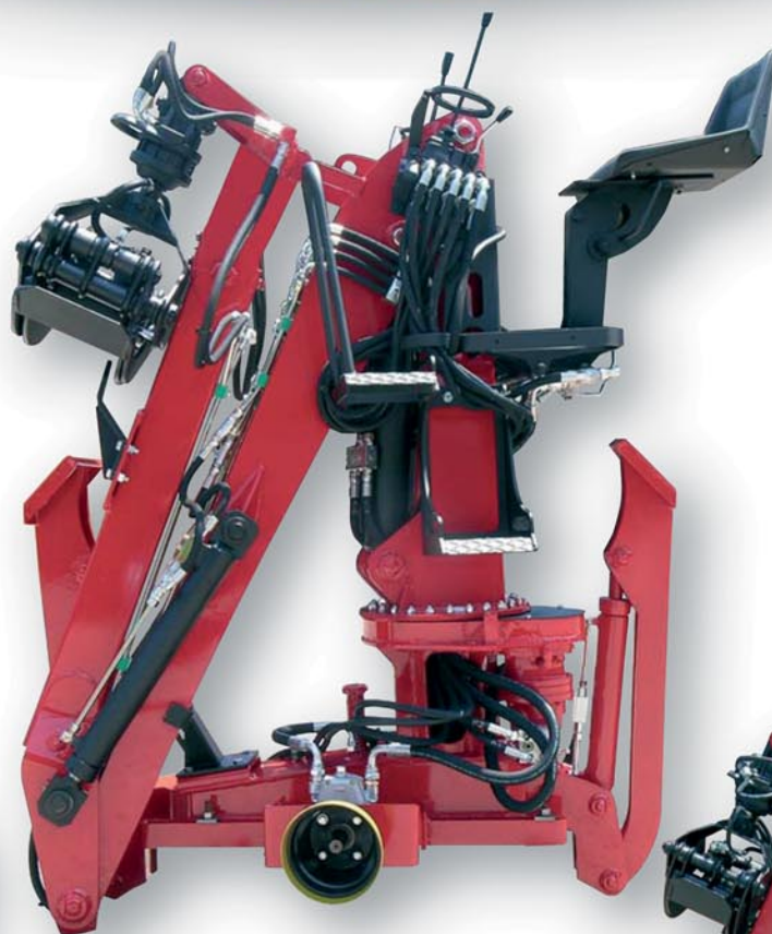
LMF 300 LMF 300 Plus