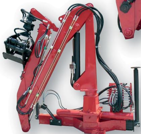
LMF 200 Light