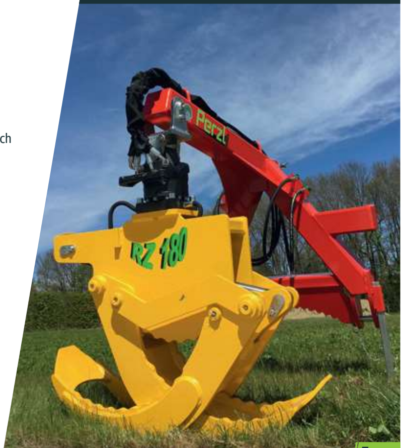
RZ 180 mit Rotor