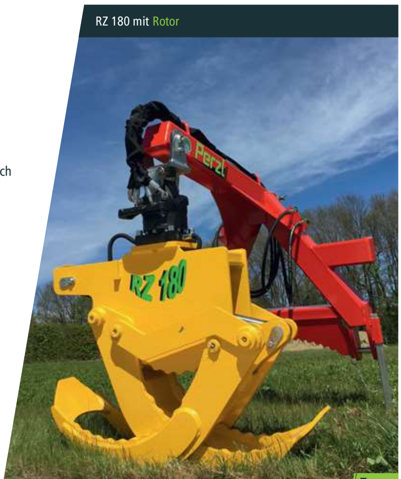
RZ 180 mit Rotor