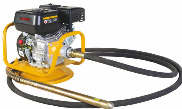
LFR-40 mit Flasche